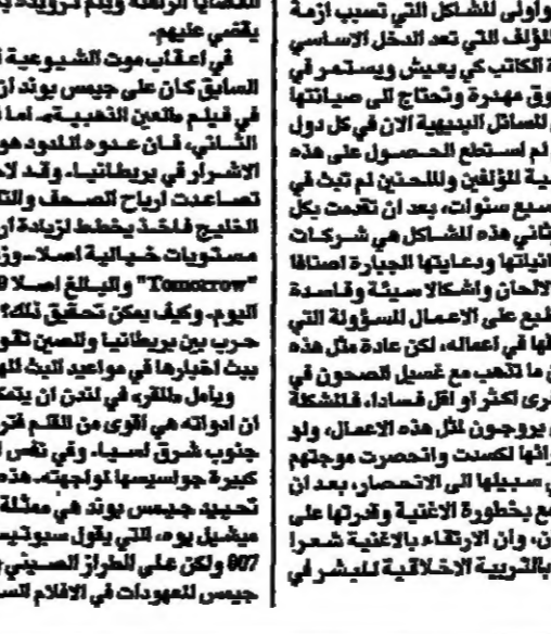
كوثر مصطفى (الفنانة العربية)